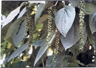
Panniyur - 1