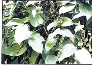
Panniyur - 2